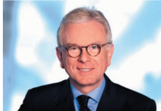
Hans-Gert Poettering o novo Presidente do Parlamento Europeu

Defender os valores da Europa, executar as reformas e fomentar o diálogo entre culturas foram outros dos pontos principais do discurso inaugural do novo Presidente do Parlamento Europeu, Hans-Gert Poettering, cerimónia na qual estiveram presentes Angela Merkel, José Manuel Durão