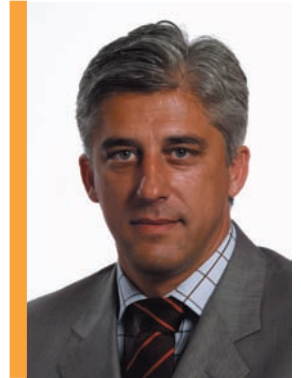
Duarte Freitas relator do POSEI Pescas

Para o Eurodeputado, os apoios concedidos ao abrigo do POSEI Pescas "têm permitido uma ajuda às economias locais onde este regime é aplicado, permitindo aos operadores económicos em causa trabalhar em condições menos desfavoráveis em relação aos seus homólogos do continente europeu".